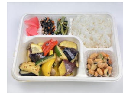
季節野菜のソテー オレンジソース (ベジタリアンの方向け)