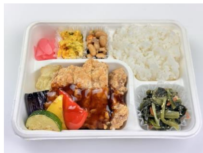
チキンタツタ黒酢ソース弁当