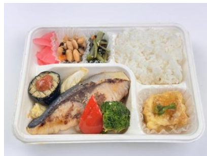
ブリの西京焼き弁当