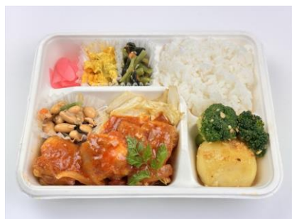
鶏もも肉のトマトソース煮込み弁当