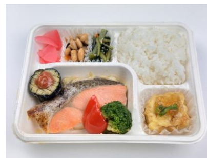
トラウトサーモンの塩焼き弁当