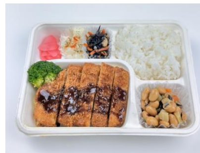
ソーストンカツ弁当