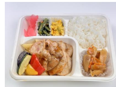
豚ロース香味焼き弁当